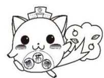
マスコット {ゆたねこ}