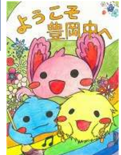
豊岡ゆるキャラ サンバード