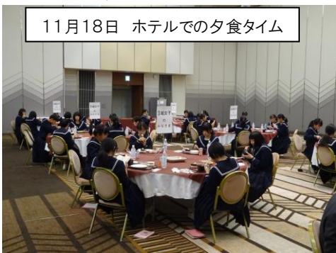
11月18日 ホテルでの夕食タイム

校長「今回の旅行では、3年生の子たちはどうでしたか?何か印象に残ったことはありましたか?」