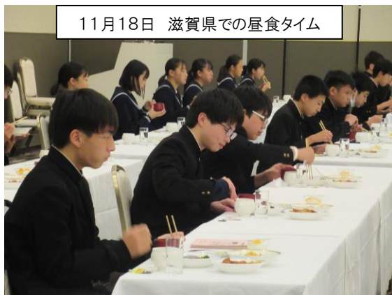
11月18日 滋賀県での昼食タイム

11月18日(木)～20日(土)の3日間、好天の中、滋賀県と三重県に出かけ、充実した思い出の修学旅行を体験しました。1年生から身につけてきたことがいかされ、いろいろな力を発揮できた3日間だったと思います。