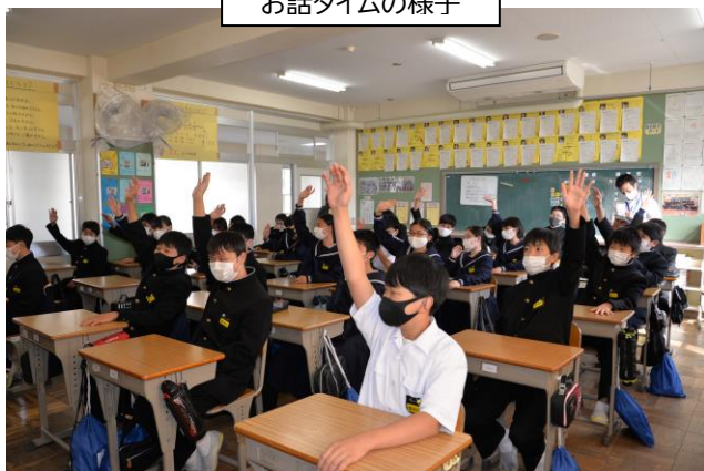
お話タイムの様子