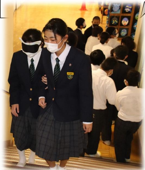
『福祉体験教室(11月22日)』