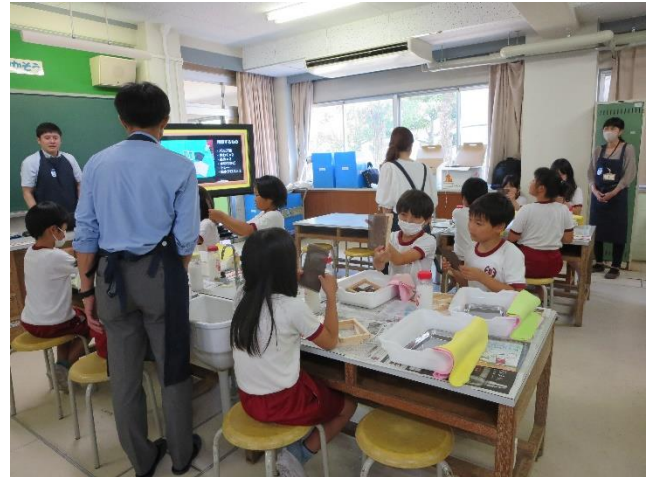
出前講座「リサイクルを学ぼう」(7月)