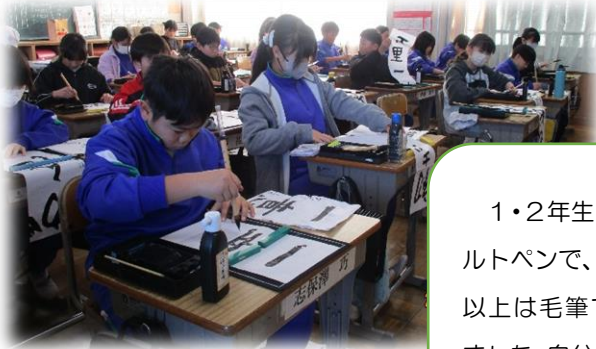
1・2年生はフェルトペンで、3年生以上は毛筆で書きました。自分の目標を書きました。