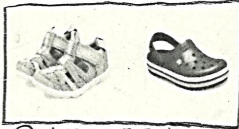
④ かかとのあるサンダル Sandália que segure no calcanhar