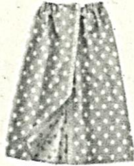
② タオル Toalha