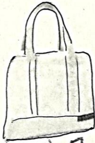
① 水着用バッグ Bolsa para sunga ou maiô.