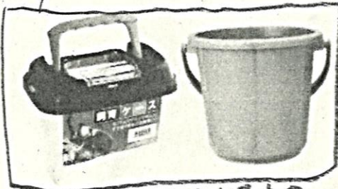
⑦ 生きものを入れるもの Recipiente ou material p/colocar os peixinhos e bichinhos.

Caso não tenha maiô ou sunga, providenciar roupa que possa molhar