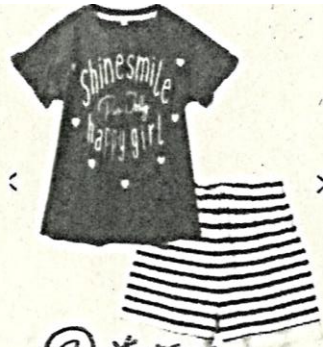
③ 着替え Troca de roupa