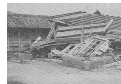
伊勢湾台風により倒壊