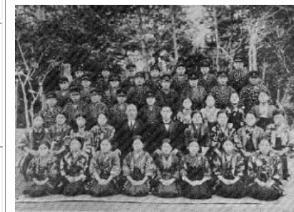
昭和の初めの頃の服装