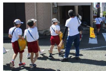
(総合・5, 6月) 校外学習の付き添い・見守り