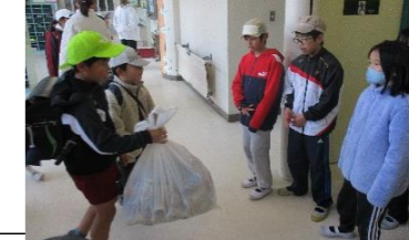
(総合・1月～)【地域住民】 自分たちが考えた取り組みを継続して行い、 地域住民に呼びかけ、協力してもらう。