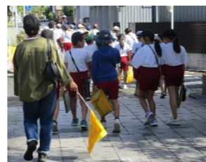
(社会・総合・9, 10月) 校外学習の付き添い・見守り