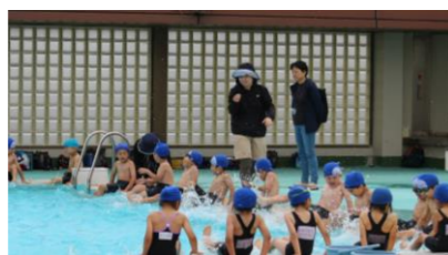
(体育・6, 7月) プール見守り