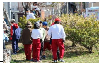
(総合・5月～)【公園】 地域探検に行き、各公園のゴミの量の違いに気づく。 再度ごみ調査を行う。