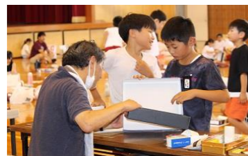
(図工・6月)【お店をつくろう】 作品製作のアドバイスをもらう。