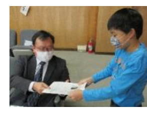
(総合・1月～)【地域住民・地域施設】 自分たちが考えた取り組みを地域や市へ発信し、 環境保護活動を実践する。