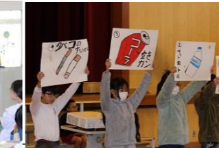
(総合・9月～)【公園】【公園近隣住民】 公園に行って、ごみを減らす方法について考える。 自分たちが考えた取り組みについて、アドバイスをもらう。 学習発表会で、ごみの現状を伝えたり、協力の呼びかけをしたりする。