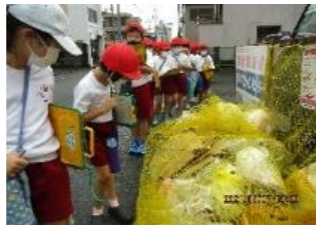
(社会・6月)【地域住民】 【ごみステーション】 ごみステーションの現状を調査したり、 家庭のゴミ出しの話を聞いたりする。