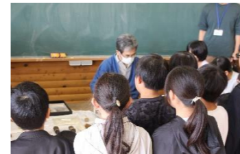
(社会・10月)【豊橋筆職人】 職人の技を見たり、筆作りに関する話を聞いたりする。