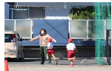
(体育・11月) マラソン大会試走の誘導・監察