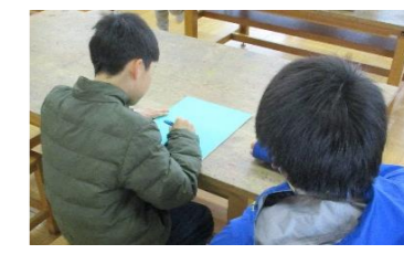
(図工・1月) 彫刻刀を使った活動の補助