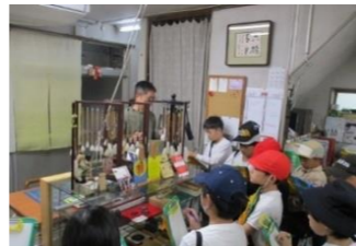
(社会・10月)【地域のお店】 豊橋筆に関する話を聞く。