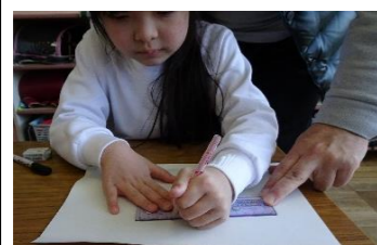
(算数・4月) 定規の使い方補助