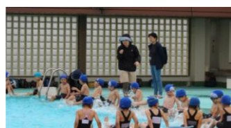
(体育・6, 7月) プール見守り