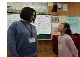
(算数・1月) 九九のきまり 地域の方に聴いてもらう。