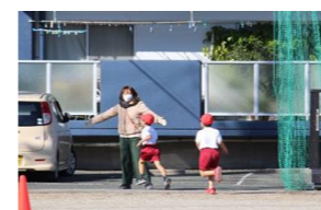
(体育・11月) マラソン大会試走の誘導・監察