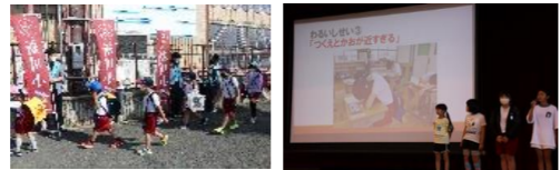
秋の530運動(9月) あいさつ運動(10月) 学習発表会(11月) マラソン大会(12月)