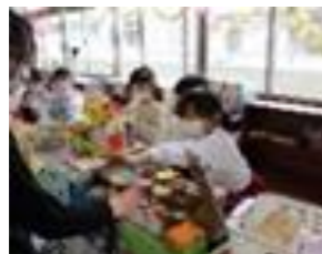
(図工・4月) 【お店をつくろう】 作品製作に向けての話を聞く。