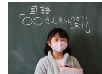
(国語・2月) この人を紹介します