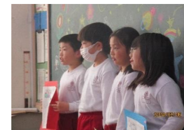
(生活・1月2月) 【自分物語】 自分の成長を振り返る。