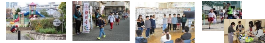
学校保健委員会(1月) 感謝する会(2月)