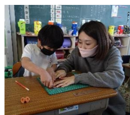
(図工・6, 7月) カッターの使い方補助