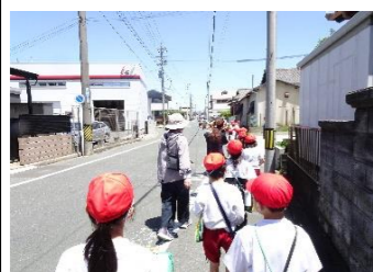
(生活・4～7月) 校区探検の付き添い・見守り