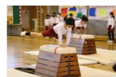
(体育・10月) 跳び箱の補助