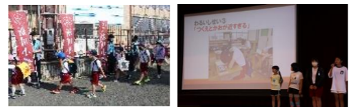
秋の530運動(9月) あいさつ運動(10月) 学習発表会(11月) マラソン大会(12月)