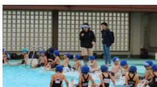
(体育・6、7月) プール見守り