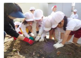
(生活・6～12月)【他学年】 花や野菜などの生き物調べたり育てたりする。育てた植物のつるを使いリースを作って、各学級にプレゼントする。