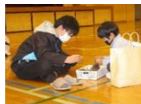
(生活・10～11月)【公園】 秋を見つけて紹介したり、集めたもので遊んだりする。