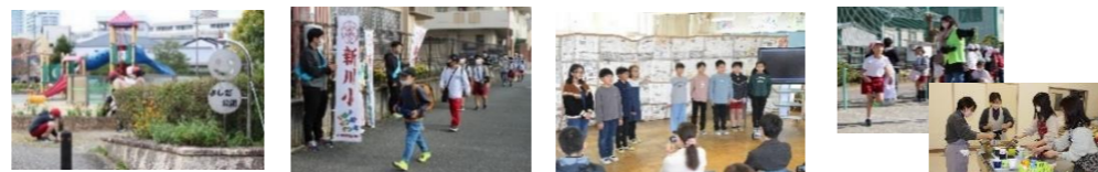
学校保健委員会(1月) 感謝する会(2月)