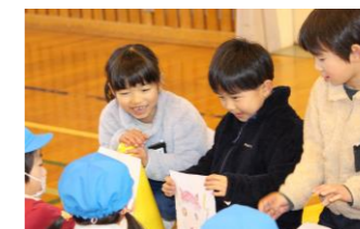
(生活・2月)【園児】 幼稚園交流会で、幼稚園の年長さんと一緒に遊ぶ。