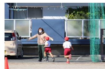
(体育・11月) マラソン大会試走の誘導・監察