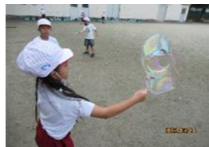
(生活・7月)【6年生】 友達や6年生と遊ぶ。