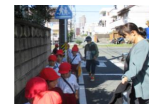
(生活・3月) 公園探検の付き添い・見守り