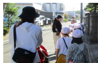
(生活・10～11月) 公園探検の付き添い・見守り