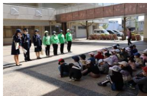
(生活・4月)【交通指導員】 通学路の安全について話を聞く。