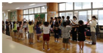
(生活・7月)【図書ボラ】 七夕会を開き、歌を歌ったり願いごとの発表をしたりする。