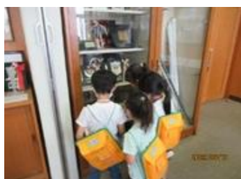
(生活・4月)【上級生・職員】 友達と遊んだり上級生や職員と関わったり、学校の様子を見たりする。