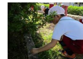
(生活・3月)【公園】 身近なところにある春を見つける。