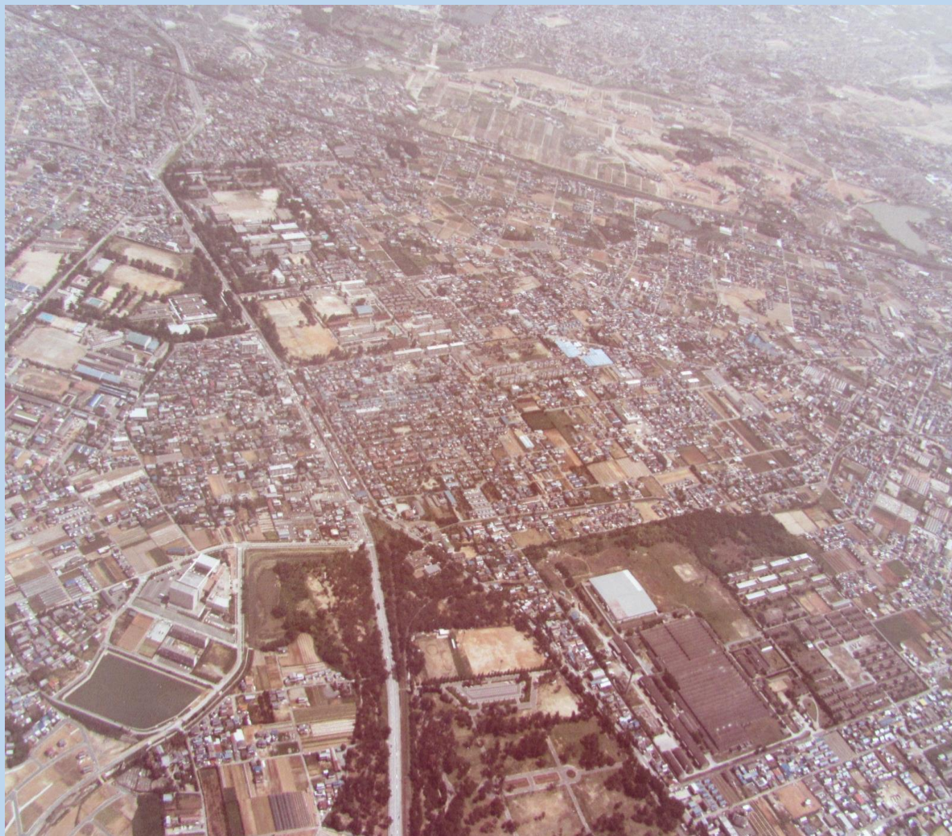
学校保管航空写真より