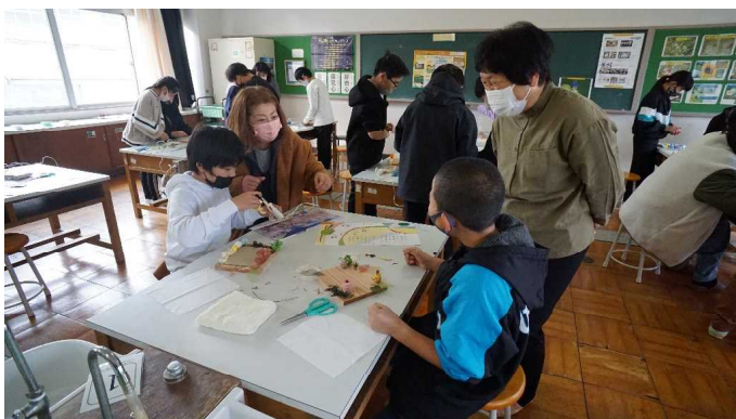
プリザーブドフラワーで写真立て(5年生)

1月14日(土)親子ものづくり教室を感染症対策として教室に入れる保護者の人数を7人までに制限しながら開催しました。お子さんと一緒に活動できるのは1回10分程度となって短いですが、保護者の皆さんの協力によりスムーズに活動することができました。