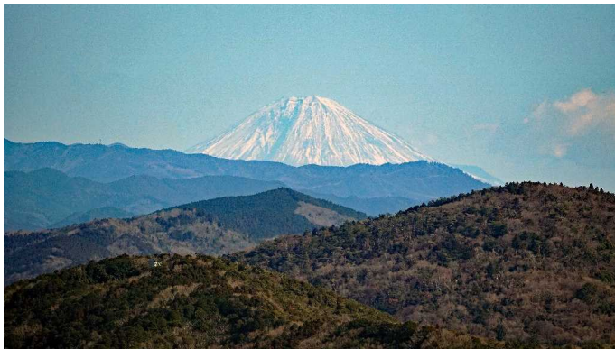
雪をかぶった富士山が大きく見えました