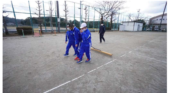
鉄パイプが溶接され、きれいに仕上げてありました

1月18日(火)、運動場をきれいに整備するブラシを平野町の卒業生の方に寄付していただきました。野球をやっていた方で、手作りのブラシです。甲子園を整備するときのブラシと同じ部品を使っているそうです。試しに野球をやっている子に引いてもらいました。ちょっと重たいですが、その分とてもきれいになりますことができるようです。大切に活用させていただきます。ありがとうございました。