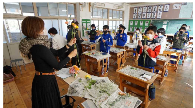
短い時間で素敵な花束ができました

1月18日(火)、6年生は職業の勉強で花屋さんのお話を聞きました。LALAフルールさんを経営している方から、どんな仕事しているか画像を見ながら説明をいただきました。その後、簡単な花束づくりの体験をさせてもらいました。20分ほどで素敵な花束が出来上がりました。花は、とても繊細なので痛まないようにいつも気をつけているそうです。花束だけでなくお店などに飾る風船なども加えたデコレーションも手がけていて、とても幅広くお仕事をされていることがわかりました。おみやげの花束ができてみんな大満足でした。