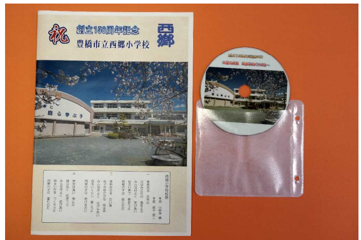
記念誌(A4カラー12ページ)と写真集DVD(パソコン用)

卒業写真については、修学旅行などの集合写真も含めることで、ほぼすべての年代の写真を集めることができました。なお、下記の写真がありましたら、西郷小学校(0532-88-0271)教頭までご連絡ください。よろしくお願ひします。