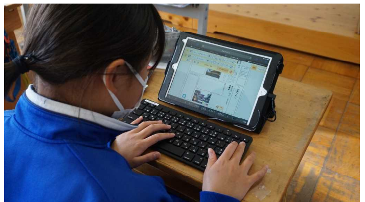
キーボードを接続して文章を入力しました