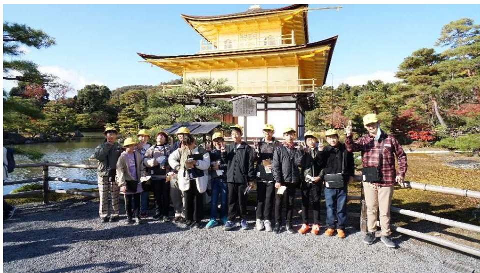
金閣は、改修工事が終わり金色に光り輝いていました

出来上がった写真は、廊下に掲示するとともに同じものを手作り新聞コンクールに応募したりしました。