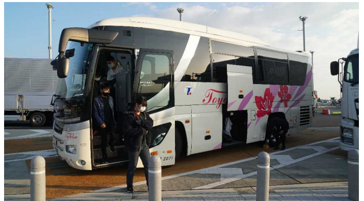
最新型の中型バス 座席にUSB充電ポートもついていました