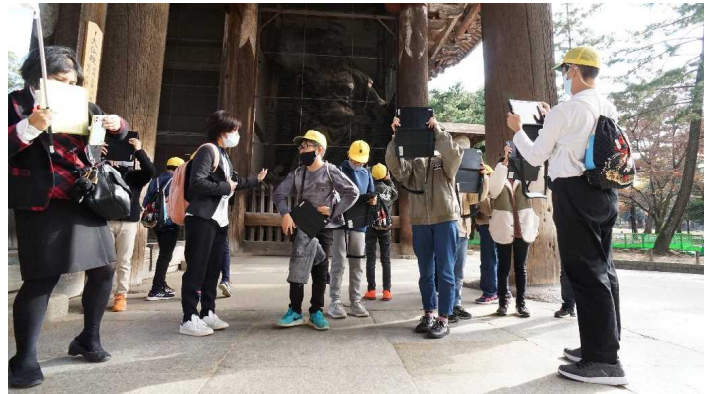
説明を聞いた後、金剛力士像を撮影する子どもたち

後日、学校で修学旅行の新聞作りは、タブレットで作りました。画面上で撮ってきた写真を簡単に貼り付けることができます。教室には、GIGAスクールでwifiが完備されているので、インターネットで学校のホームページのコネタの日記から写真を利用することもできました。