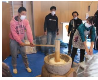
協力して、もちをつきました。