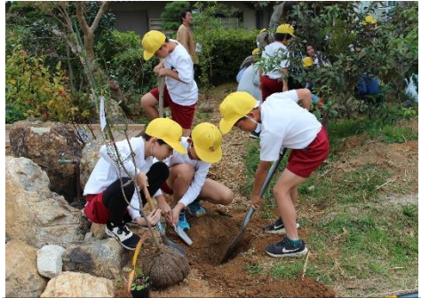
子どもたちの手による植樹。保護者の方にも参加していただきました。