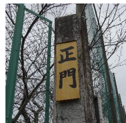
書：近藤康代 様 塗装：森長塗装 様