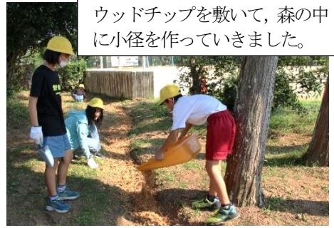
ウッドチップを敷いて、森の中に小径を作っていました。