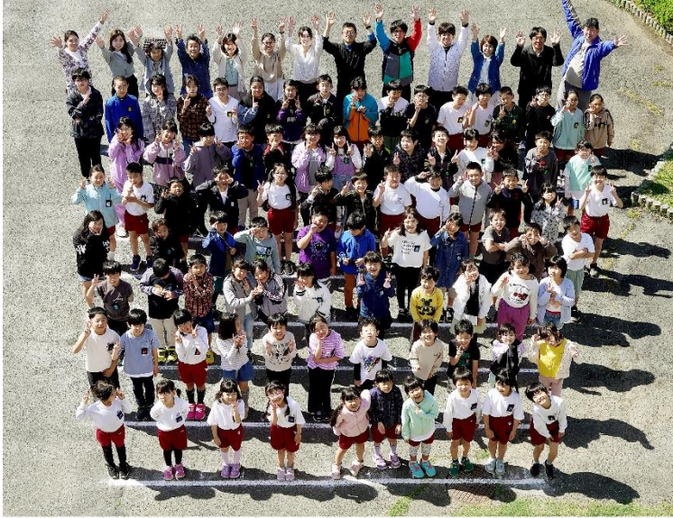
祝150周年記念 豊橋市立小沢小学校 全校児童集合写真（2023年撮影）