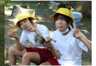
おいしいカレーができました