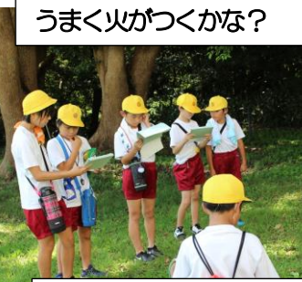
自然の中でのウォークラリー