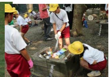
昼食はカートンドッグ