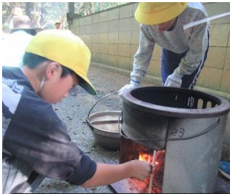
うまく火がつくかな？

9月19日(火)は、4・5年生が少年自然の家に出かけ、野外活動を体験しました。9月半ばとは思えない暑さでしたが、子どもたちは元気いっぱい自分たちの食事を準備したり、ウォークラリーを楽しんだり、貴重な体験をすることができました。仲間との楽しい思い出を作り、一回り成長したのではないのでしょうか。