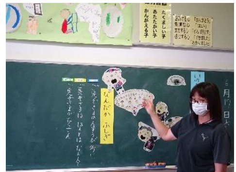
▲たんぽぽ道徳『いのちのまつり』

「いのち」って不思議 みんなが玩気でいられるように、一人一人の命を大切にしないで話を通して学ぶことができました。