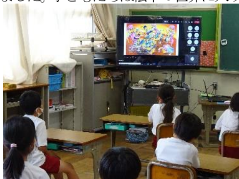
▲教室で保健委員会の発表を聞く子どもたち