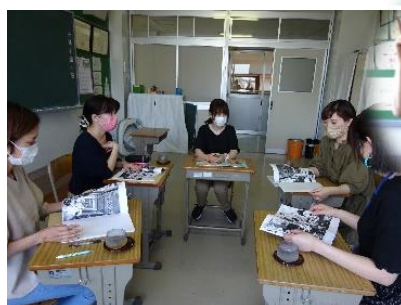
◀『給食番長』の読み聞かせを録音する図書ボラさんたち