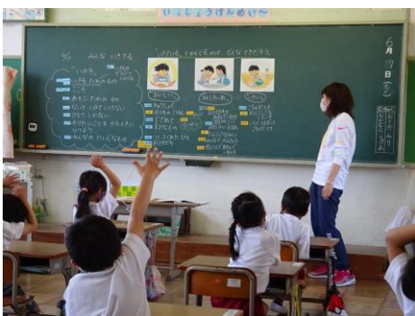
▲1年道徳『みんな いきてる』