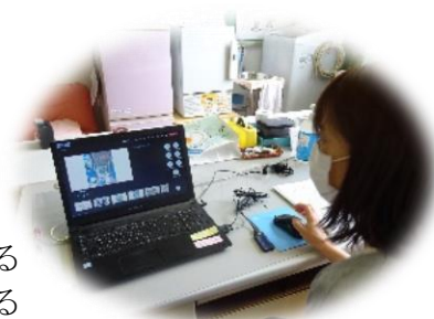
▲保健室からデータを配信