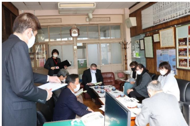
2月8日（月） 学校評議員会