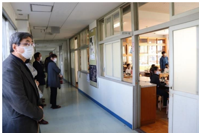
学校評議員による授業参観の様子