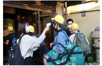
施設に入る前には検温を！