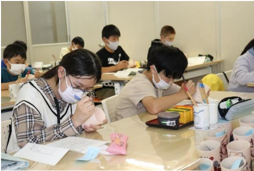
絵付け体験 みんな真剣