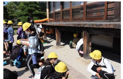
うぐいす張りの仕組みは どうなっているのかな