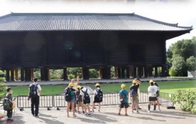
歴史的建造物をしっかり見て勉強