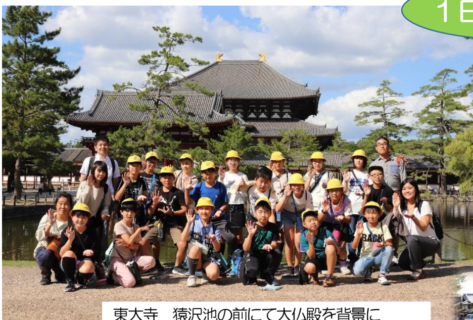
東大寺 猿沢池の前にて大仏殿を背景に