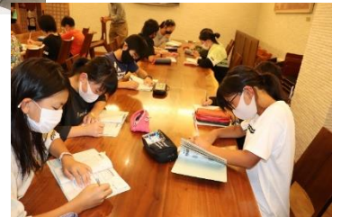
一日の振り返りをして就寝