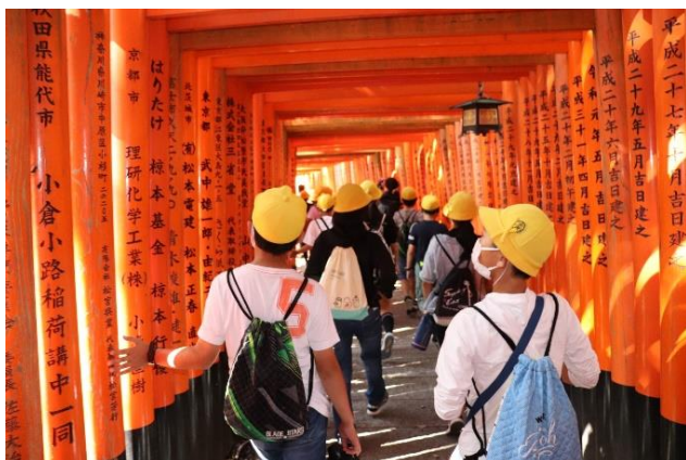
伏見稲荷の赤い鳥居 素敵だね