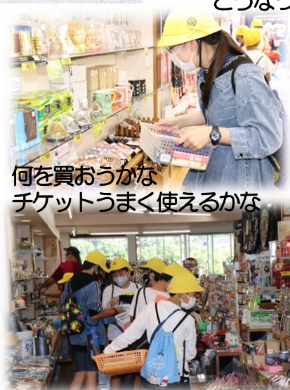
何を買おうかな チケットうまく使えるかな