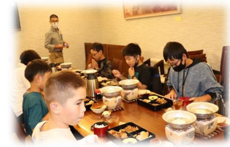
みんなでおいしい夕食