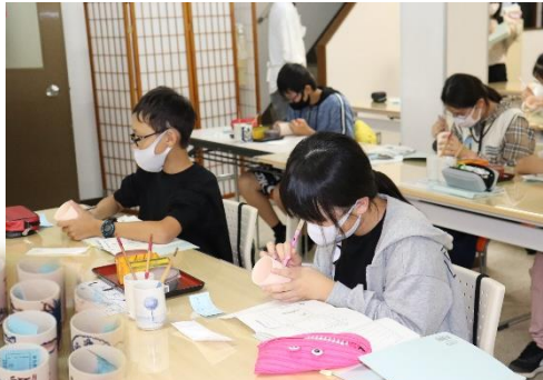
仕上がりが楽しみです