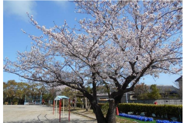
校庭の桜がみなさんの入学を待っていました

いよいよ待ちに待った小学校生活がスタートします。何もかもが初めてですが、みんなで元気よく一歩を踏み出してほしいと願い、学年通信を「げんきっこ」としました。「げんきっこ」は、学校からのお知らせや子どもたちの様子を伝えるおたよりとして、発行します。よくお読みいただき保管してください。