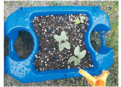
先生のアサガオ「芽が出たよ。」

まずは、学校のある生活リズムに慣れることが大切です。早寝早起きに気をつけて、朝ごはんをしっかり食べて元気に登校できるようにしましょう。よろしくお願ひいたします。