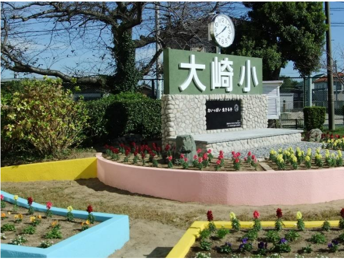
【150周年記念モニュメント】

10月24日(火)、同窓会役員・理事、大崎町・船渡町自治会役員・組総代をお招きして、「150周年記念モニュメント除幕式」を行いました。本校東門のすぐ横に設置しましたので、お気づきになられたかたもいらっしゃるかと思います。