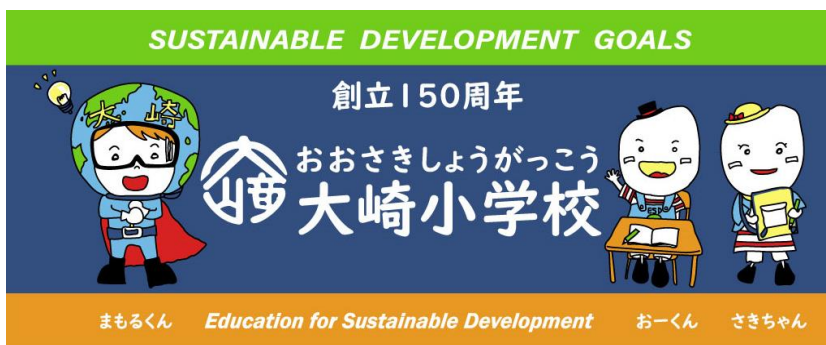
【150周年記念グッズのタオル】

いずれも、校区・地域の皆様や事業所様、企業様の多大なご協力があったからこそ、実現できたものです。引き続き、皆様にお力ぞえいただきまして、大崎小学校が皆様とともに、ますます発展していくことを、職員一同、心から願っております。どうぞよろしくお願いいたします。