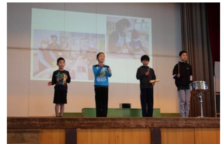
【げんき組 げんきぐみの ~おもをどうぞ!~】

みなさまにご参観いただいたおかげで、子どもたちは充実した時間を過ごすことができました。ほんとうにありがとうございました。