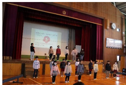
【2年 このお手紙はだれのもの?】