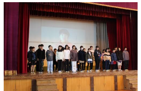
【6年 My Memory ~ぼくらの足跡~】