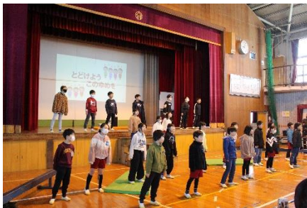
【3年 星のだいぼうけん】