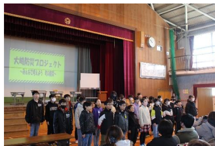
【5年 大崎防災プロジェクト ~みんなで考えよう 町の防災~】