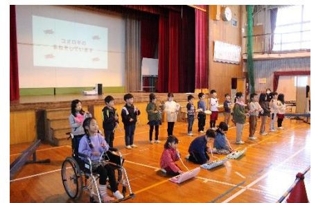
【1年 大崎のいきものたちの なあぜ なあぜ?】