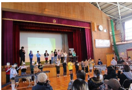
【4年 STAND BY ME ~僕のそばには梅田川~】