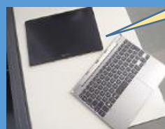
中学校は Windows タブレット