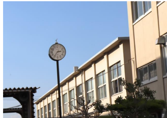
〈創立75周年記念で同窓会からいただいた時計塔〉

どんなことでも構いません。学校と家庭とが、生徒一人一人の成長を温かく見守り、支えていきたいと考えます。時間的には、お一人10~15分程度しかとれませんので懇談内容や質問内容を整理してくださると助かります。よろしくお願ひいたします。