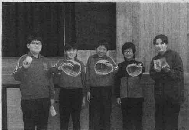
グラブを受け取った子どもたち（豊橋市立幸小学校で）