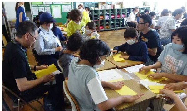
<ひまわりの花を折る活動>

このような地道な活動が地域に貢献していると認められて、今回、日本善行会から表彰を受けました。応援してくださる地域のみなさまのおかげであり、これまで継続して取り組んできた松山っ子の努力の賜物です。ありがとうございました。