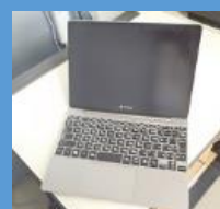
中学校は Windows タブレット