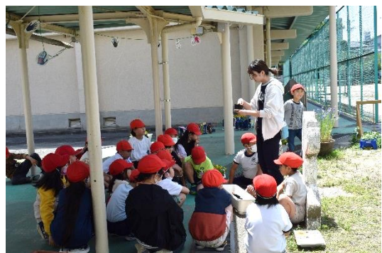
&lt;ヒマワリの種まき～3年生～&gt;