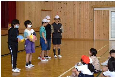
&lt;6年生の話を真剣に聞く下学年&gt;

今年度は遊びだけでなく、行事等でも縦割り班を活用していきます。縦のつながりをもつことで同学年だけで楽しむのとは別の楽しさが味わえます。高学年の責任感が増すことも期待されます。今後どのような活動ができるか楽しみです。