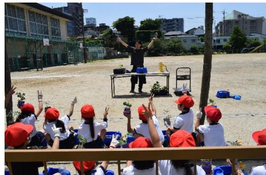
&lt;苗の扱い方も教わりました～2年生～&gt;

子どもたちは夏に美味しい野菜ができること、きれいな花が咲くことを願って、世話を続けていきます。