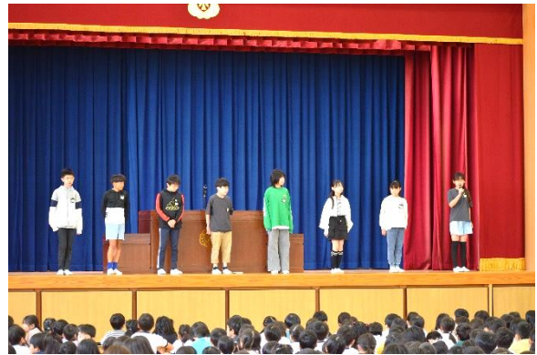
<各委員会委員長の抱負発表>