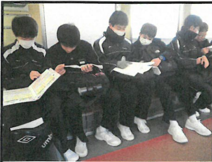
入試に向かう車内でも、寸暇を惜しんで勉強する3年生たち。このやる気が素晴らしい！！