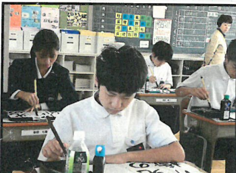
最後の競書大会でした。一筆に集中する真剣な眼差し。立派です。

「後期にやりたいこと」というみんなへの質問には「レク」という答えがたくさん見られました。こうしたことも実現していきます。もちろん勉強も大事なので勉強会をおこなったり 面接練習などをしたり