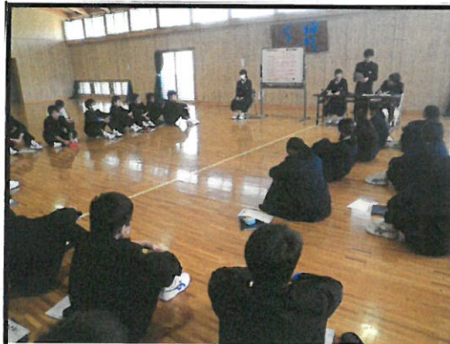
修学旅行スローガン決めのための学年 集会を開きました。始めはぼつんぼつん としか意見が出ませんでした。後半は リーダーを中心に自分の考えを発言で きました。次はもっとloud voiceで!

学年全員に募集し、集会で多数決をとった ところ、このスローガンに決定しました。5つの 輪には、それぞれ 団結力. 思い出. 学習 吸収. 成長 という願いが込められています。