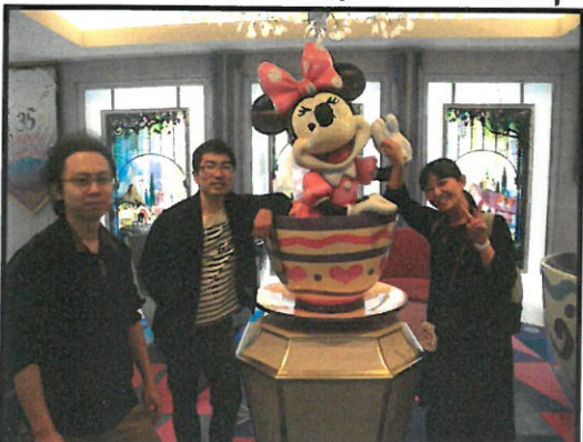
修学旅行の下見に行ってきました。ここ はセレブレーションホテルです。ミニー ちゃんが君たちが来るのを待っています。