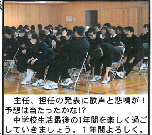
主任、担任の発表に歓声と悲鳴が！予想は当たったかな！ 中学校生活最後の1年間を楽しく過ごしていきましょう。1年間よろしく。

昨日1日、君たちの様子を見させてもらいました。最も印象に残り感心したのは、 静かに式が始まるのを待てたこと です。約20分間、じっと待つ姿に中学生としての成長を感じました。その後歌った校歌もよい声が出ていました。これも凄い。これを今後も継続し、集会でも Big voice を!! 言葉と姿で前芝中をリードしてください。