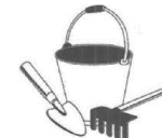
しおひがりの道具