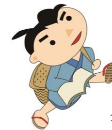
金次郎くん (前芝小キャラクター) (前芝中キャラクター)