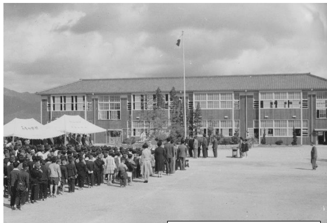
昭和33年旧校舎竣工式