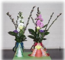
カルチャークラブ作品