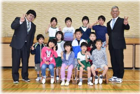
12名の1年生が仲間入り