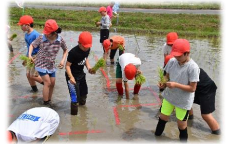
田植えて文字アートに挑戦