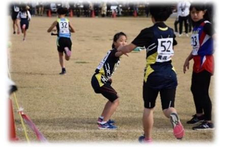
駅伝大会 たすきでつないだ絆