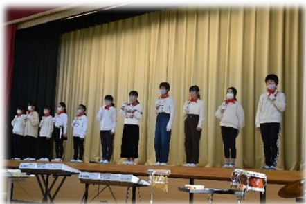
学習発表会でのハンドベル演奏