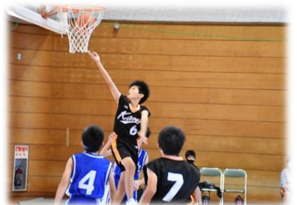
最後の球技大会 力を出し切りました