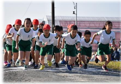
全力でスタート！ マラソン大会