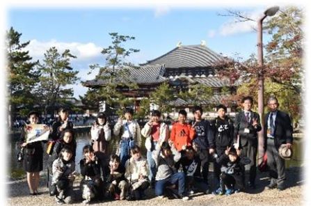
今年はバスで修学旅行に行きました