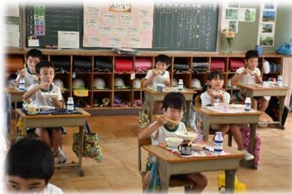
給食は黙々と前向き