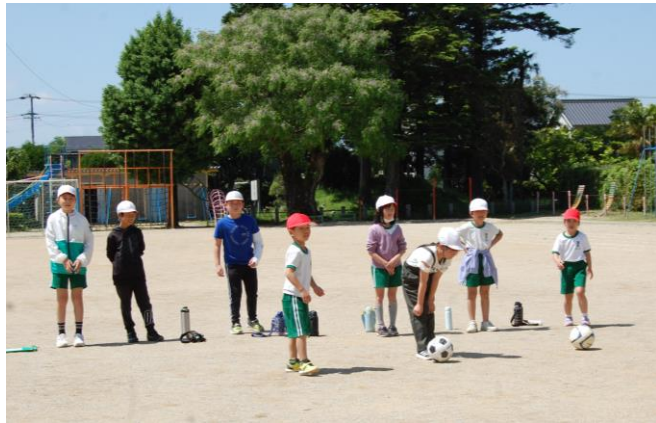
縦割り班で活動したウォークイン賀茂小学校