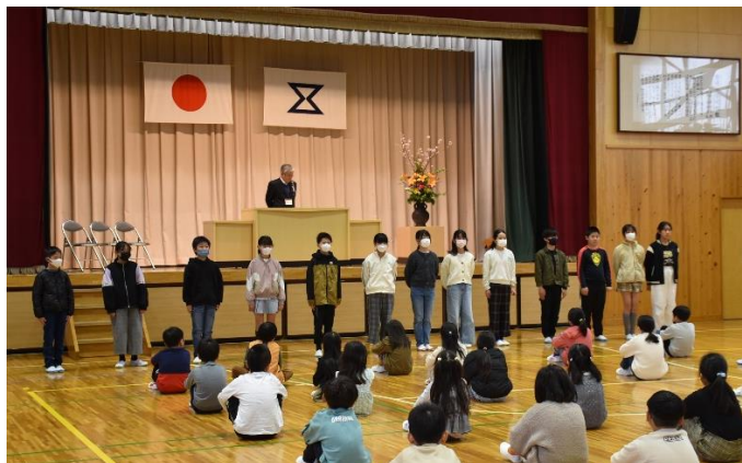
始業式で今年の目標を宣言する6年生

第49号 発行 豊橋市立賀茂小学校 〒441-1101 豊橋市賀茂町字森信24番地 ☎(0532)88-0400