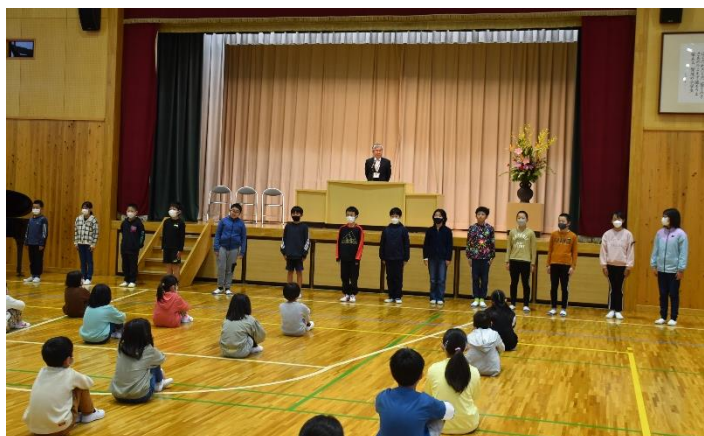
始業式で今年目標を宣言する6年生