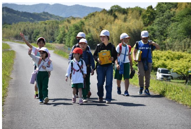
縦割り班で校区を歩くウォークイン賀茂