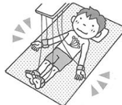
② 手首・足首・胸に器具をつけてもらいます