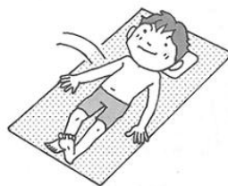
① ベッドに横になります