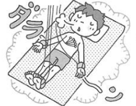
③ ダラーンと力を抜いて動かない