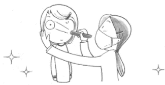
お医者さんが両方の目に光をあてます