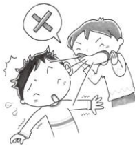
みみちとおおこえで大きな声を出さない