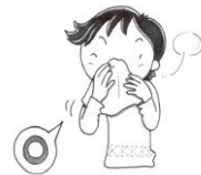
はなをかむときは片方ずつゆっくりかむ