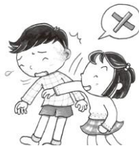
みみちかかお顔をたたかない