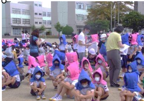
▲地震に備えて避難訓練中

10月4日に、大規模地震を想定した避難訓練を行いました。児童は、緊急地震速報を聞き、いったん机の下にもぐって一時避難した後、揺れが収まってから運動場まで避難しました。今回は、西階段が使用不可になった想定だったため、東階段からほとんどの児童が避難しましたが、スムーズに落ち着いて移動することができました。