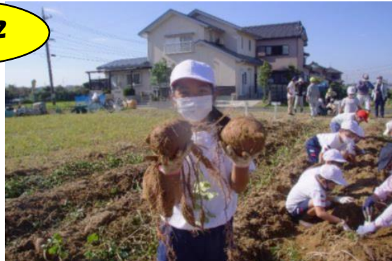
▲こんなに大きなお芋が獲れたよ

12日、2年生が地域の畑で芋ほりを行いました。老人連合会の皆さんが、前日につるを切ったり土を掘り起こしたりして、下準備をしてくださいました。おかげで、大きなお芋がたくさんとれて、子どもたちは大満足。掘り出したお芋を両手に持って、「かぼちゃみたいにまるくて大きいね。すごい！」とびっくりしていました。家に2回に分けて、持ち帰るほど、豊作でした。また、芋のつるは、1年の生活科「あきとなかよし」で取り組んでいる「リースづくり」の材料として利用させていただきました。老人連合会とママの会の皆さん、ありがとうございました。