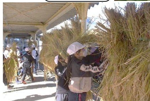
▲はざかけ、稲の乾燥中です