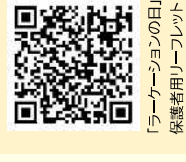
保護者用リーフレット 「ラーケーションの日」