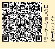
ポータルサイト 「ラーケーションの日」