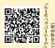
「ラーケーションカード」 (小中学生用)