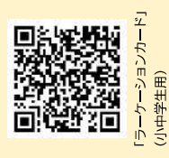
「ラーケーションカード」 (小中学生用)