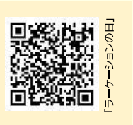
「ラーケーションの日」