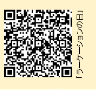
「ラーケーションの日」