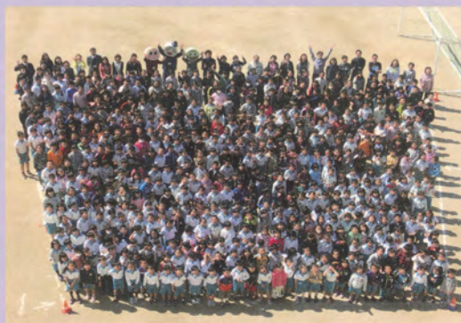
平成25年度全校児童（530名）