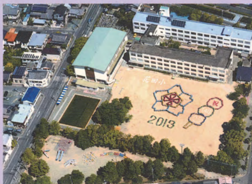
140周年記念航空写真（5月7日撮影）