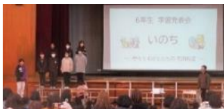
守ろう私たちの花田校区

創立百五十周年を最高学年として迎え、新しい伝統を自分たちの手で創り出そうと、全力で取り組んできました。一年生を最優先に考えたフレンド活動では、活動を工夫し優しく見守る姿が見られました。スポーツフェスティバルの帽子取りでは、自分たちで考えた言葉の掛け合いや全校への呼びかけに大きな拍手をもらいました。防災学習では、国語・総合的な学習・道徳を通して、命や防災、生きるということに真剣に向き合い、学習発表会で力強く表現できました。これら一つの経験が、皆を六年生として大きく成長させてくれました。いよいよ卒業の日が近づいてきました。花田小学校の六年生としての誇りをもって、最後まで一人一人のよさを生かして、新しい伝統を創り続けてくれることを期待しています。