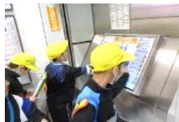
豊橋駅バリアフリー調査

学年目標「真心」にこめた願いのとおり、どんなことにも真剣に向き合い、一人一人ができることを考え、誠実に努力してきました。来年度は最上級生。花田小のみんなの笑顔のために、心をこめて力を尽くす。そんな姿が見られると信じています。