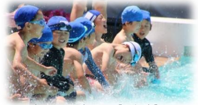
初めてのプール 【1年生】