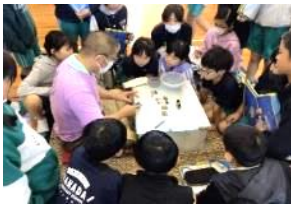
豊橋筆の出前講座

学年目標「(overwall)に込めた願いどおりに、どんな問題にも、四年生全員と担任二人で乗り越えてきました。何に対しても前向きで、パワーあふれる高学年になることを期待しています。」