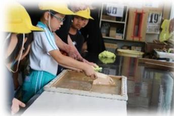
山佐染工所での体験 【3年生】