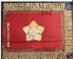
額装された旧学校旗

これから先、新たな学校旗とともに、更に歴史を刻んでいく花田小学校を見守り続けていくことでしょうか。学校にお越しの際は、ぜひご覧ください。