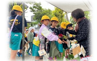
一五の市で買い物 【2年生】