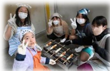
ヤマサちくわの出前講座 【4年生】