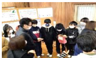
学習発表会での募金活動

また、お子さんの願いを受け止め、寄り 添い、支援をされる保護者の姿にも心動か されました。保護者だからこそできるこ ような支援により、子どもは自己肯定感や 自己有用感を高めながら、大きく成長して いきます。家庭と学校が協力し、花田っ子 一人一人の可能性をより引き出したいと いう思いを再確認する機会になりました。