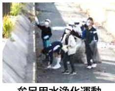
牟呂用水浄化運動

生活委員の呼びかけに、自主的に参加をした子どもたちが、元気に挨拶できる学校にしたいと、挨拶をしながら教室を回りました。令和6年度も、このような自主的な活動を支援していきます。