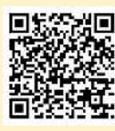
「ラーケーションの日」