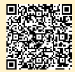
「ラーケーションの日」